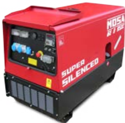
GE 8 YSXC →

YANMAR / monofásico / super insonorizado