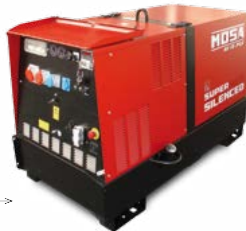
GE 15 PSX →

PERKINS / trifásico / super insonorizado