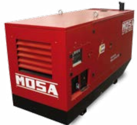
GE 275 FSX →