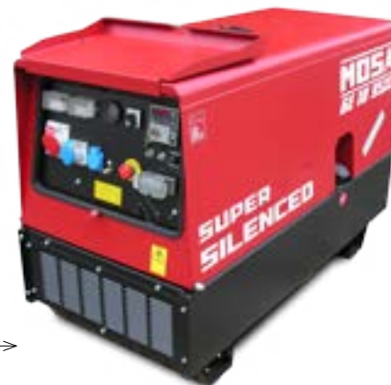
GE 10 YSXC →