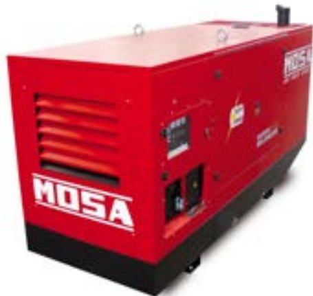
GE 165 FSX →

FTP (IVECO) / trifásico / super insonorizado