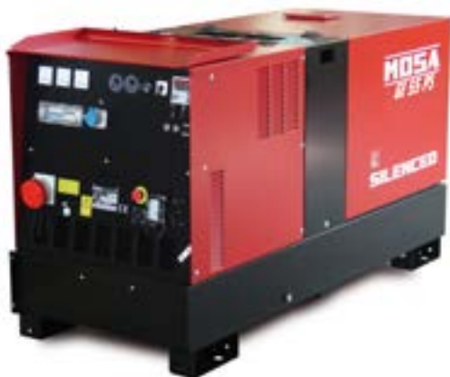
GE 55 PS →

PERKINS / trifásico / super insonorizado