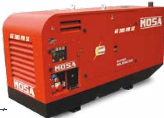
GE 385 FSX →