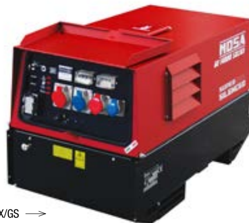
GE 14000 KSX/GS →