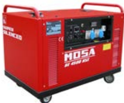
GE 4500 HSX →