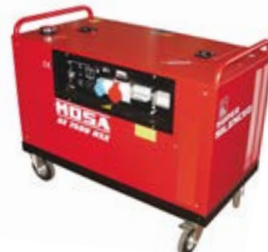
GE 7500 HSX →