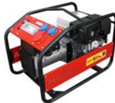
GE 9000 TBH RENTAL →