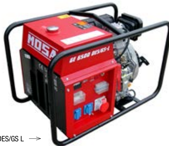
GE 6500 DES/GS L →