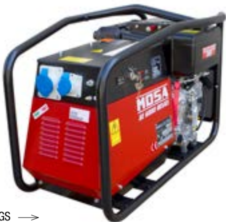
GE 6000 DES/GS →