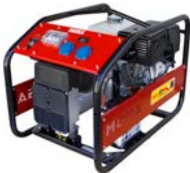
GE 7500 MBH RENTAL →