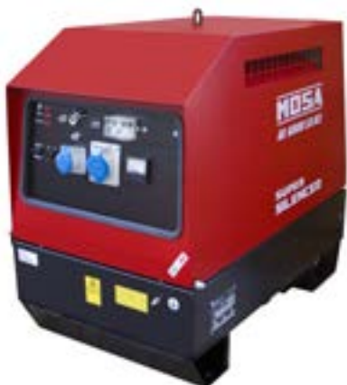
GE 6000 SX/GS →