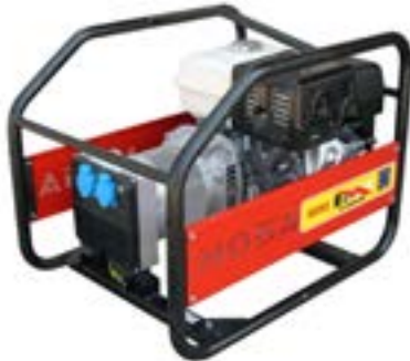
GE 5000 MBH →