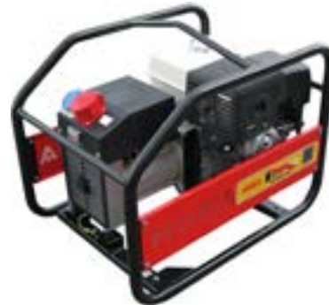
GE 6000 TBH →